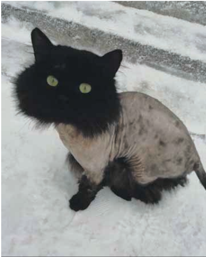
Еще совсем недавно этот кот был обладателем густой черной шерсти

Мало того, что собаку выбросили как ненужную вещь, ей еще и выкололи глаз. А в ноябре минувшего года в ночь, когда было объявлено штормовое предупреждение о заморозках, на аллее у торгового центра в «Интернате» неизвестные оставили двух