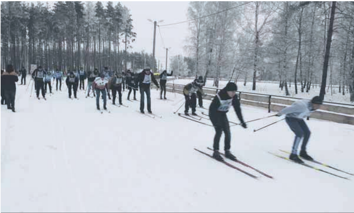
Во второй спартакиаде по лыжным гонкам «ЭкоНиваАгро» приняли участие 150 спортсменов-любителей

— По сравнению с прошлым годом, когда дул сильный ветер