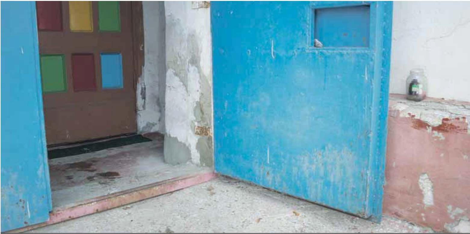
Жители двухэтажек по улице 40 лет Октября ждут не дождутся капитального ремонта в подъездах

— Управляющая компания не имеет право погашать задолженность одного собственника за счет других. В этой ситуации собственникам необходимо контролировать УК и составлять акты приемки оказанных услуг и выполненных работ по содержанию и текущему ремонту общего имущества в многоквартирном жилом доме (далее МКД), которые ранее были заявлены на годовом общем собрании собственников помещений в ежегодном плане расхода средств на содержание общедомового имущества, в со-