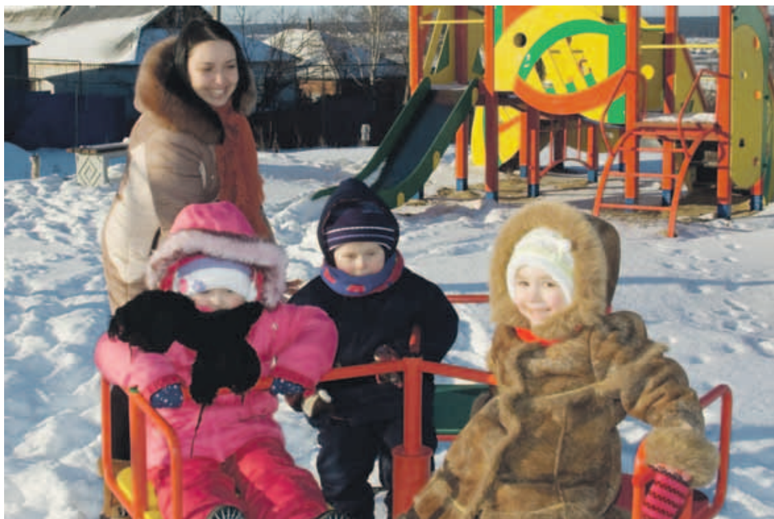
Даже в зимнюю пору селявенские ребятишки любят гулять на своей новой детской площадке.

селявенцев можно назвать подготовительным – для осуществления двух самых значимых проектов за последние годы. Речь идет о строительстве в 2015 году нового водопровода и средней общеобразовательной школы на 160 мест. Для нее уже подобрана