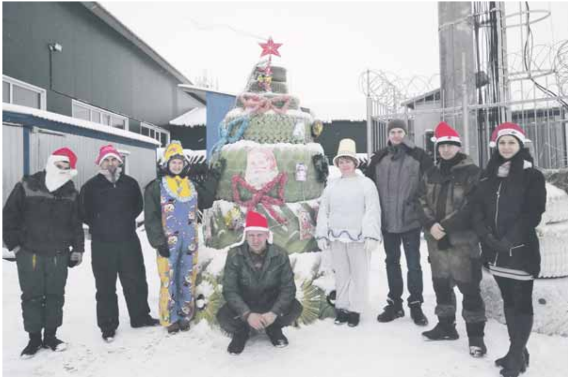
Свою елку механизаторы выстроили прямо во дворе мехмастерской

В лискинском сельхозпредприятии устроили конкурс на самую креативную елку