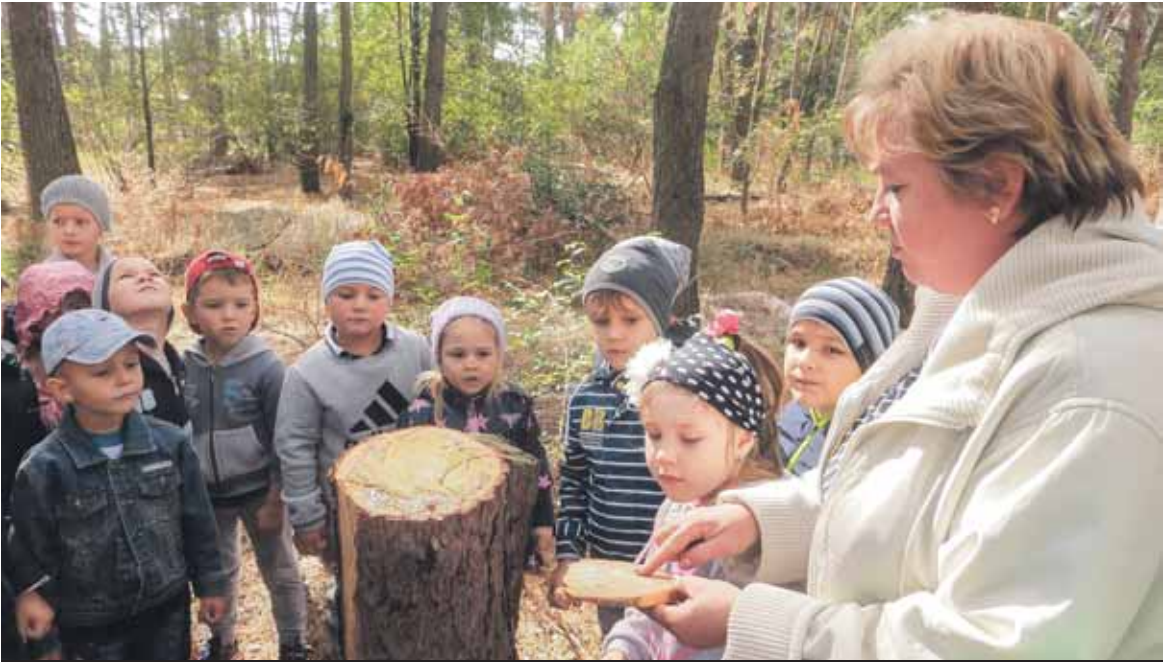
Для воспитанников детсада № 4 такие экскурсии — лучший урок бережливого отношения к лесным богатствам