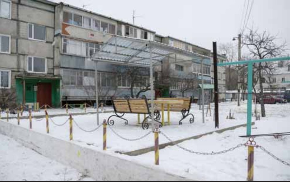
С первого взгляда видно, что двор возле дома № 32а преобразился