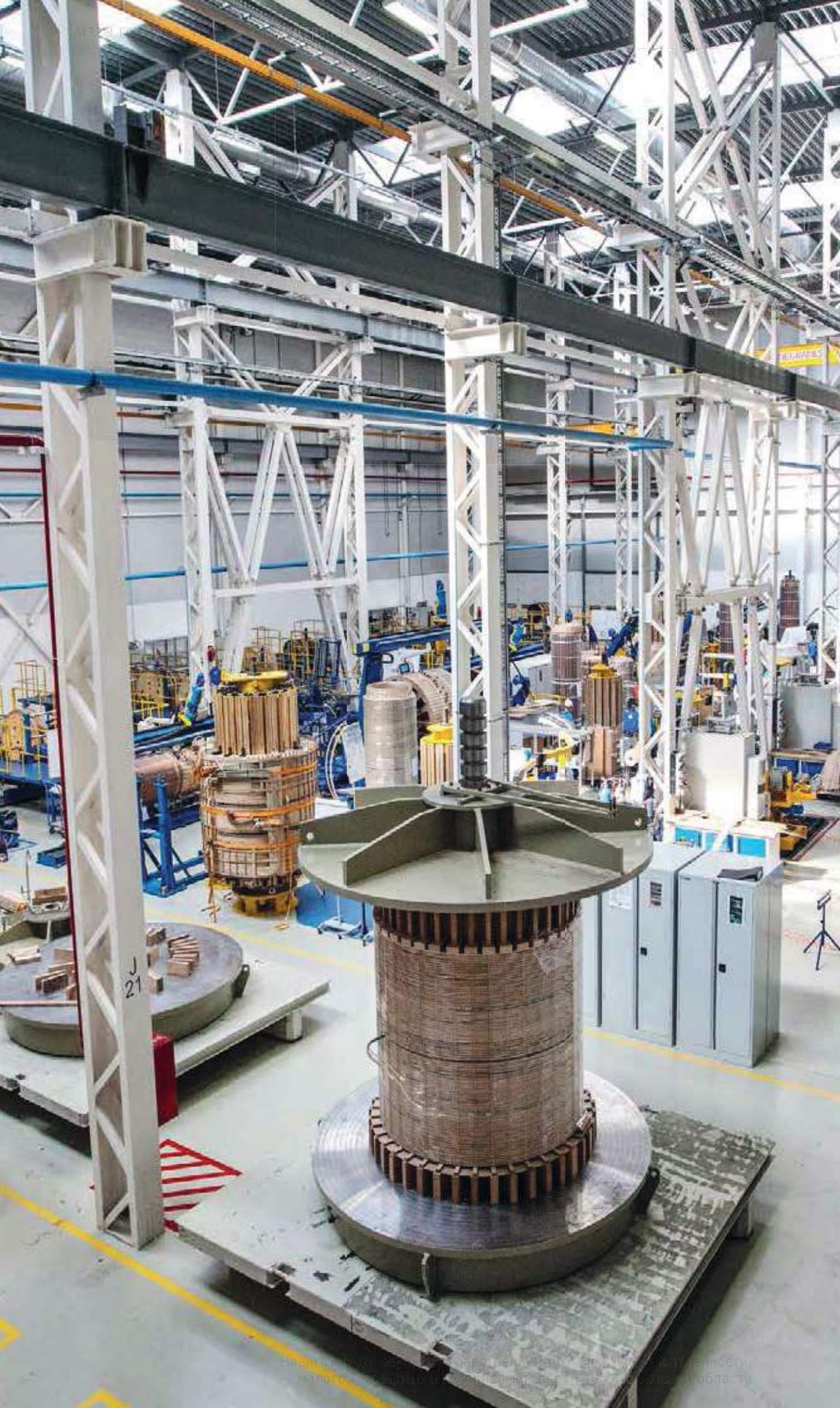
Наши станки работают с материалами различной жесткости, малой, средней и большой площади поверхности в заводской области